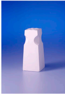
Entwurf: Ben Koßmann

Aufgabe "Schachfigur": exemplarischer Entwurf des weißen Springers nach selbstverfasstem Briefing