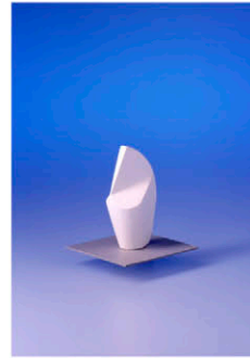
Entwurf: Barbara Stang