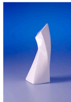
Entwurf: Katja Weißmann