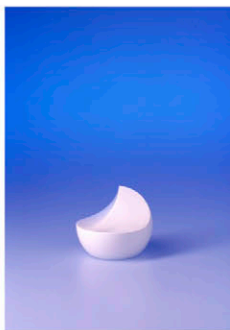
Entwurf: Rolf Brantsch