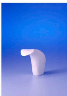
Entwurf: Yildiz Akkus