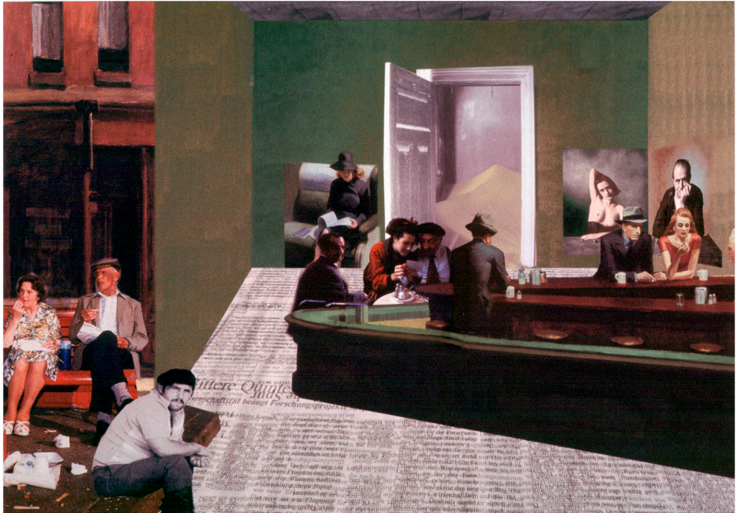
Lichtblau! ... Design zwischen Beliebigkeit und Werten Aufgabe "Mystery Roast" (Teil 1): Collage nach einem Textfragment