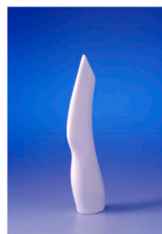
Entwurf: Thilo Haut