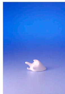
Entwurf: Tanja Rieger