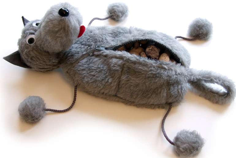
„Im Wolfspelz“ von Martin Güntert: Stiftemappe mit Erstfüllung in Form von Wackersteinen (Bonbons), entworfen für den Verkauf im Brüder Grimm Museum in Kassel.

Ein schöner Aspekt dieses Projektes war, dass die Studierenden gleich zu Studienbeginn die ihnen meist noch fremde Stadt näher kennenlernten und über die Projektarbeit erste Anbindungen entstanden.