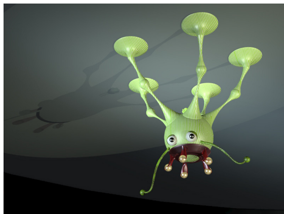
Entwurfsaufgabe „Muffelschnupfler“, Lösungs- und Darstellungsvorschlag: Beate Tertilt, 2004

www.raap-design.de/pdf/raap_prst2.pdf (Entwurfsaufgaben als PDF)