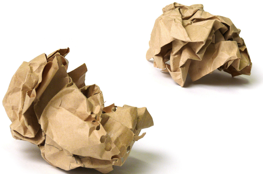
„Vom Entwerfen und Verwerfen“, Titelfoto der Seminarfolien im Studium Generale

Ein besonderes Highlight stellen für mich die Veranstaltungen im Studium Generale dar. Warum dies so ist? Üblicherweise arbeite ich in der Hochschullehre mit jungen Menschen zusammen, deren Erfahrungsschatz und Wissen entsprechend ihrem Alter noch relativ gering ist. Das Publikum im Studium Generale hingegen setzt sich aus reifen Menschen zusammen, die oft auf ein komplettes Berufsleben zurückblicken, etwa als Konstrukteur, Psychologe, Softwareentwickler. Sie bringen jede Menge Wissen und Lebenserfahrung mit und ihre Wissbegier ist noch lange nicht gestillt! Das Unterrichten dieser „Studierenden“ erfordert einen völlig andere Didaktik, vor allem um eben dieses vorhandene wertvolle Wissen sinnvoll einzubinden. Eine unglaublich bereichernde Herausforderung und Erfahrung.