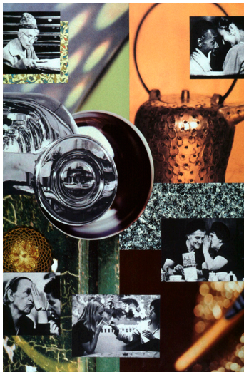
Studentische Arbeit entstanden bei der Bearbeitung des Themenbereiches „Collagen als Kommunikationsmittel“ Collage: Barbara Stang, 2003

www.raap-design.de/praesenz.html (Veröffentlichungen als PDF)