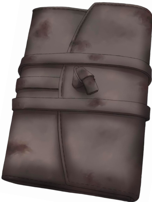
Beispiel für eines der gefundenen Objekte: Das Notizbuch einer jungen Astronomin – erdacht und gezeichnet von Sarah Wehrle.

In ferner Zukunft entdecken Forscher eine „Zeitkapsel“. Bei dieser kann es sich beispielsweise um einen verschütteten Raum oder Ähnliches handeln. Dort finden sie Zeugnisse, Objekte, Aufzeichnungen von Menschen einer ihnen unbekanntes Kultur. Wer waren diese Menschen? Warum waren sie dort? Was ist mit ihnen passiert? Welche Fundstücke werden geborgen und welche Geschichten verbergen sich hinter diesen?