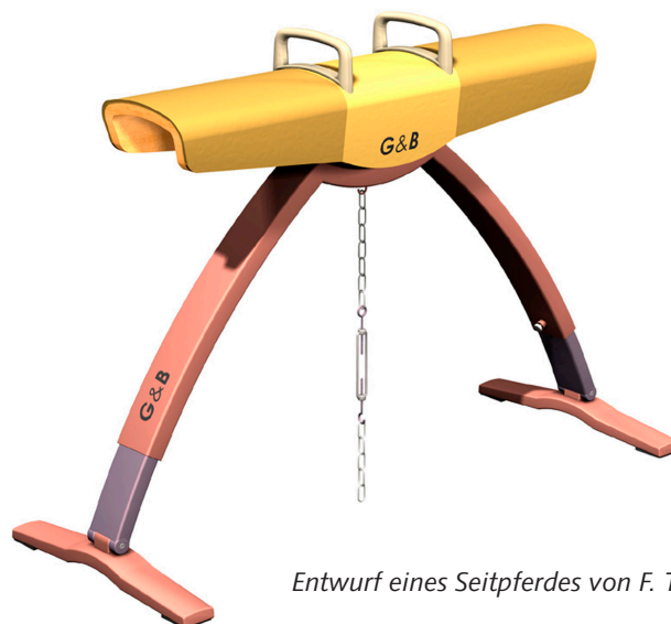
Entwurf eines Seitpferdes von F. Thilo Haut

Entwerfen kann man anhand vieler Aufgabenstellungen lernen, aber konkrete Projekte mit einem Industriepartner durchzuführen bringt eine ganz spezielle Dimension ins Spiel: die Studierenden müssen – mehr als in hochschulinternen Projekten – eine eigene Position entwickeln, um ihre Entwurfsentscheidungen glaubhaft vertreten zu können. Nur mit diesem „Standing“ kann es gelingen, den Industriepartner auch für ungewöhnliche Lösungen zu begeistern und dessen Kompetenz voll einzubinden und auszuschöpfen. Ein gutes Training für das spätere Berufsleben.