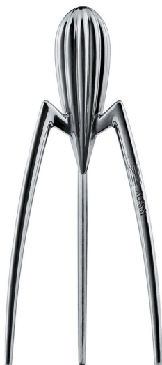
„Juicy Salif“ von Philip Starck

„Wahrnehmen, verstehen, Worte finden“ auf: „ designwissen.net “, einer redaktionell und fachlich betreuten Internetplattform, die Fakten, Theorien und Unterrichtshilfen für Pädagogen und Schüler anbietet www.designwissen.net/seiten/wahrnehmen-verstehen-worte-finden